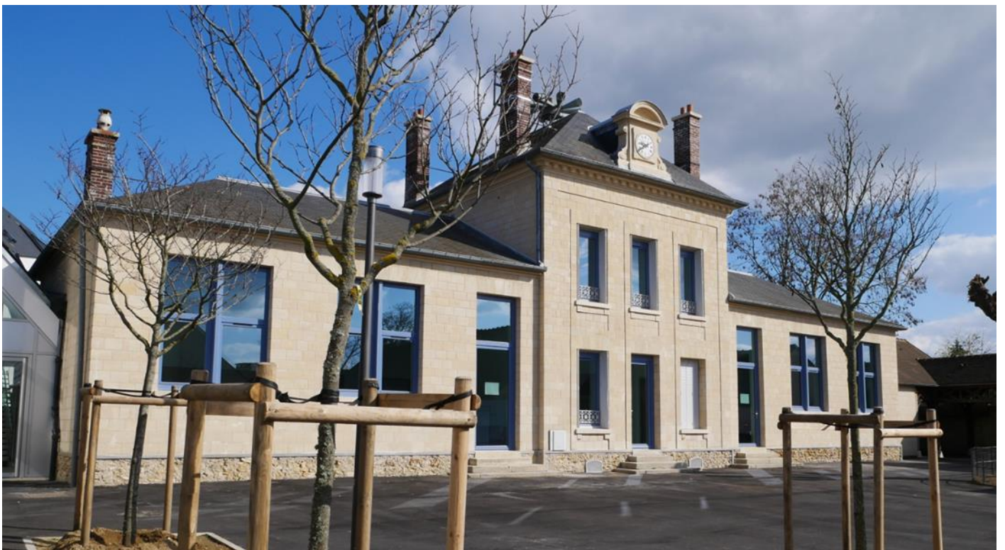
Bâtiment historique de l'école de Neuville